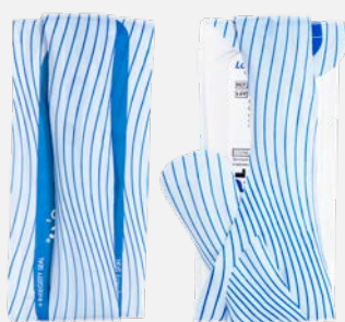
Pliable – tient dans la poche pour plus de discrétion.